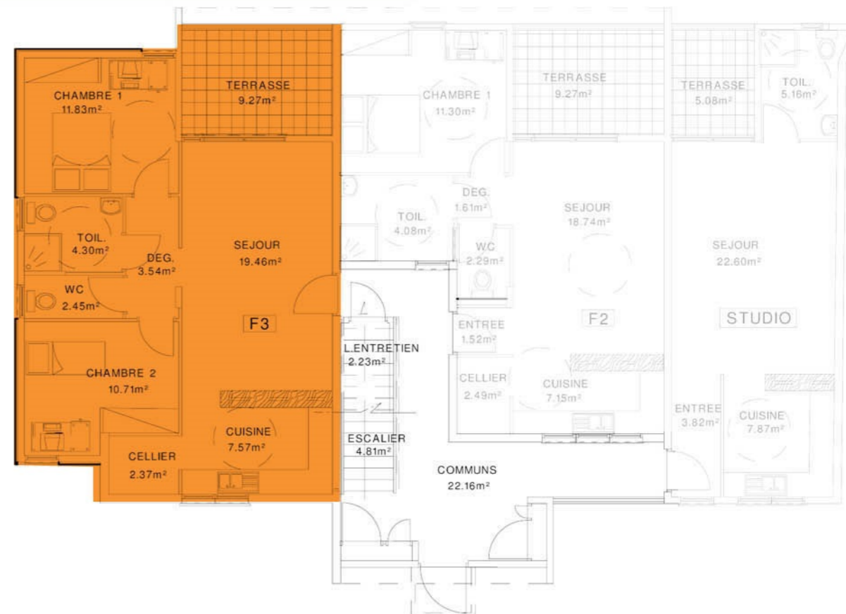
PLAN DU REZ DE CHAUSSEE