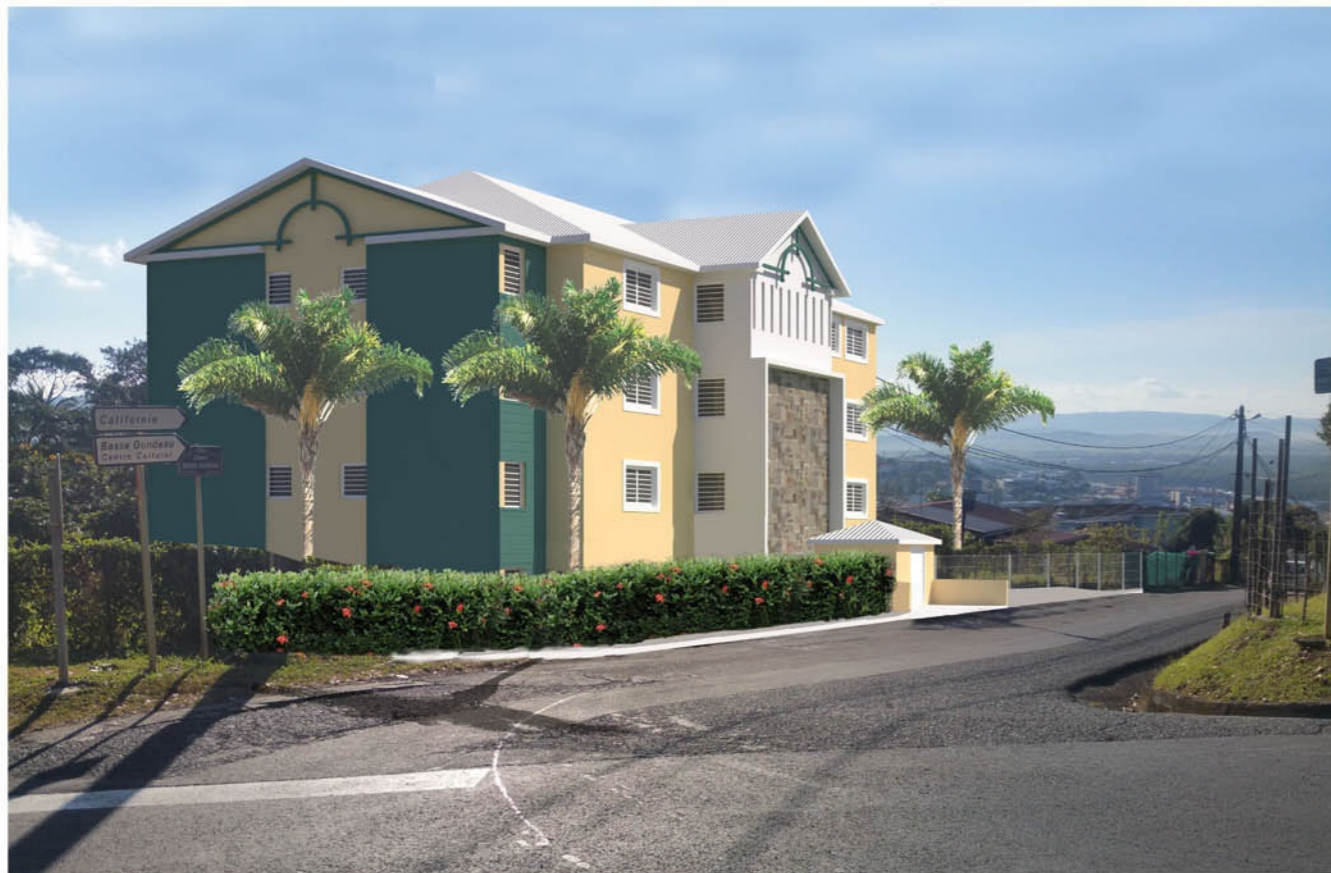
INTEGRATION AU SITE