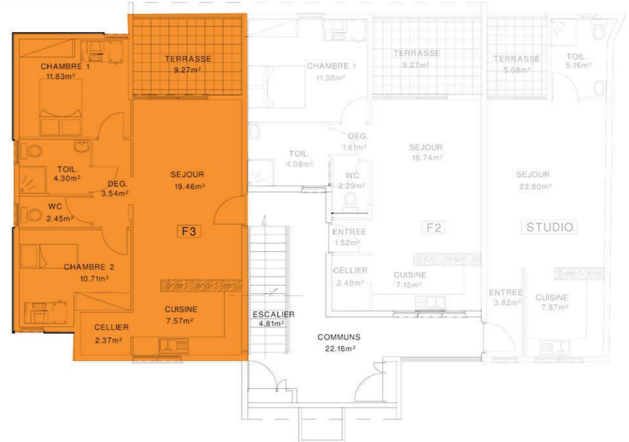
PLAN DE L'ETAGE 2