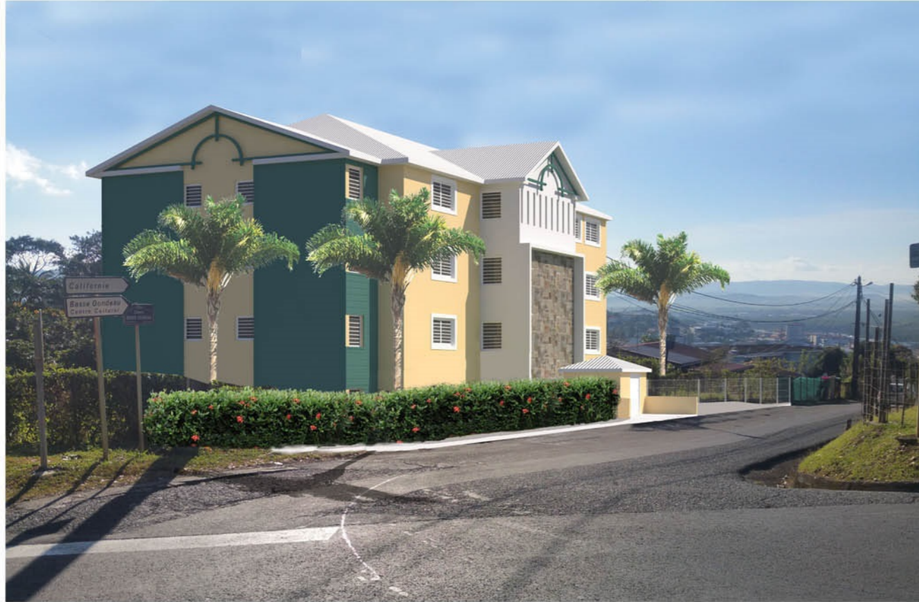
INTEGRATION AU SITE