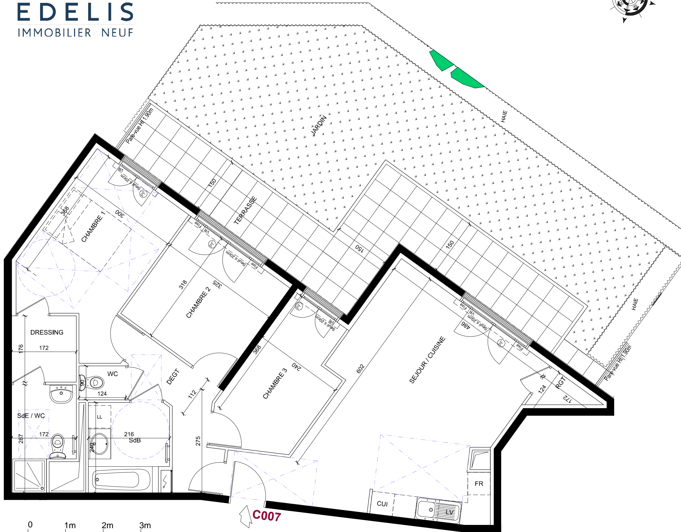
TABLEAU DE SURFACES

16 à 20 avenue de la Défense du Bourget, 13 et 15 rue de l'Abbé Niort LE BLANC-MESNIL ( 93150)